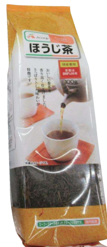
ほうじ茶 100g 422円(税込)