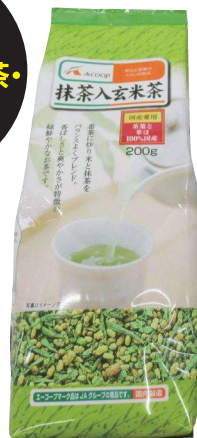
抹茶入り玄米茶200g 627円(税込)