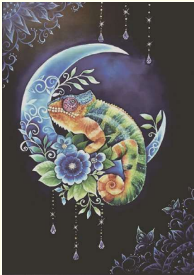
various changes ～七変化～