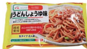
焼うどんしょうゆ味 295円(税込)