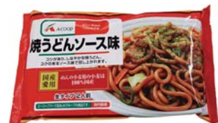
焼うどんソース味 295円(税込)