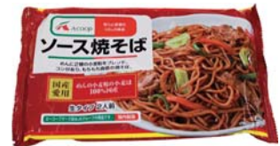
ソース焼そば 324円(税込)

100%国産小麦のもちもち麺がおいしいです。調理も簡単、お手軽に召し上がれます。