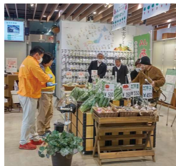
のらぼう菜フェア会場

3月12、13日に渋谷区のJA東京アグリパークで「のらぼう菜フェア」を開きました。このイベントは初の試みで、あきる野市特産ののらぼう菜を多くの人に知ってもらうことが目的です。2日間で230袋ののらぼう菜を販売したほか、だんべえ汁、のらぼう菜入りお弁当、おやき等の販売を行い大好評でした。