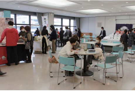
来場客でにぎわう会場

2月14、15日に本店で、JAにしたま、JA西東京との合同企画で、装いフェスタ2024を開きました。JA全農の協力のもと、東洋羽毛工業(株)の毛布や布団、岐阜アグリフーズ(株)のプロハーブ化粧品、その他お茶、装飾品、健康器具などを展示販売しました。JA西東京の女性部員がバスで来場するなど、2日間で約98人の来場客があり、盛況でした。