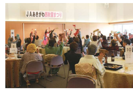
演芸を楽しむ参加者

1月31日、女性部西秋留支部はあきる野ルピアで、4年ぶりとなる女性部祭りを開きました。部員と招待客66人が集まり、演芸ボランティア団体「やすぎの会」の芸を鑑賞しながら食事を楽しみました。食後は部員や職員による踊りやダンスが披露され、最後は参加者全員で東京音頭など5曲を踊りました。