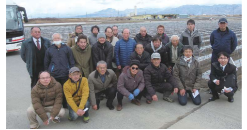
視察農場で記念撮影

1月24日、スイートコーン部会は、視察研修会を開き、山梨県JA山梨みらい管内を訪れました。会員20人が参加し、トウモロコシの早出し栽培技術を学びました。同地区では水田の裏作りに、トウモロコシの早出し栽培を行っており、現地の栽培農家より、大小二重のビニールのトンネルを使用した発芽に必要な温度を確保する栽培方法を教わりました。