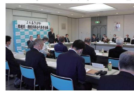
出席した部会代表者ら

1月30日、各部会代表者30人、JA役員30人が集まり、23令和5年の各部会の活動を報告しました。4年ぶりに行事や大会などが再開され、活動が活発に行われたことが発表されました。同時に開かれた、健康管理高齢者福祉推進委員会では、24(令和6)年も人間ドックや巡回検診など組合員の健康管理に力を入れていくことが決まりました。