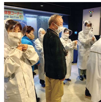
レインコートに着替える部員

3月15日、秋川消防署主催で、防火女性の会視察研修会が開かれました。JAの女性部役員17人が、墨田区にある東京消防庁本所防災館を訪れました。暴風雨体験コーナーでレインコートに着替え、風速30mの暴風雨を体験するほか、地震体験、火災による煙からの避難体験を行いました。体験を通じて、災害時の行動と対策など防災知識を身につけることができました。