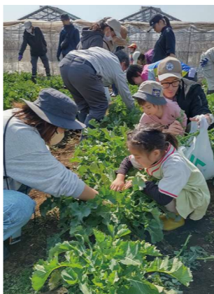
のらぼう菜を収穫する参加者

3月16日、24年あぐりスクールを開校しました。管内に住む親子に農作業を楽しんでもらい、自然や農業への興味、関心を高めることなどが目的です。11家族46人の申し込みがあり、この日は9家族36人が参加し、のらぼう菜の収穫とジャガイモの植え付けを行いました。