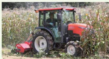
フレールモアでのトウモロコシ茎刈り