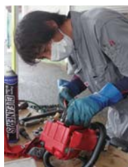
チェーンソー修理