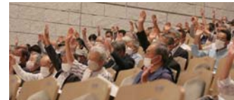
全議案承認可決となりました