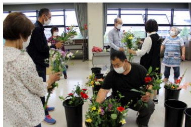
花卉部 切り花情報交換・勉強会