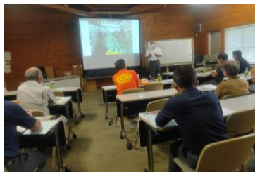
直売所運営委員会 研修会