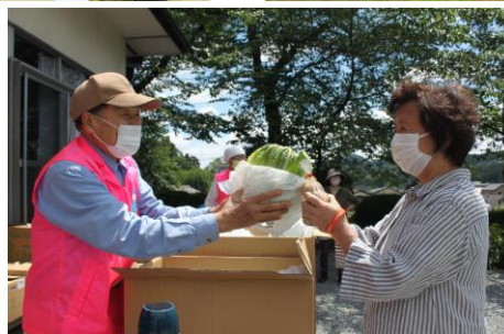
地域コミュニティ事業